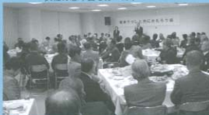
地域の今後を語る