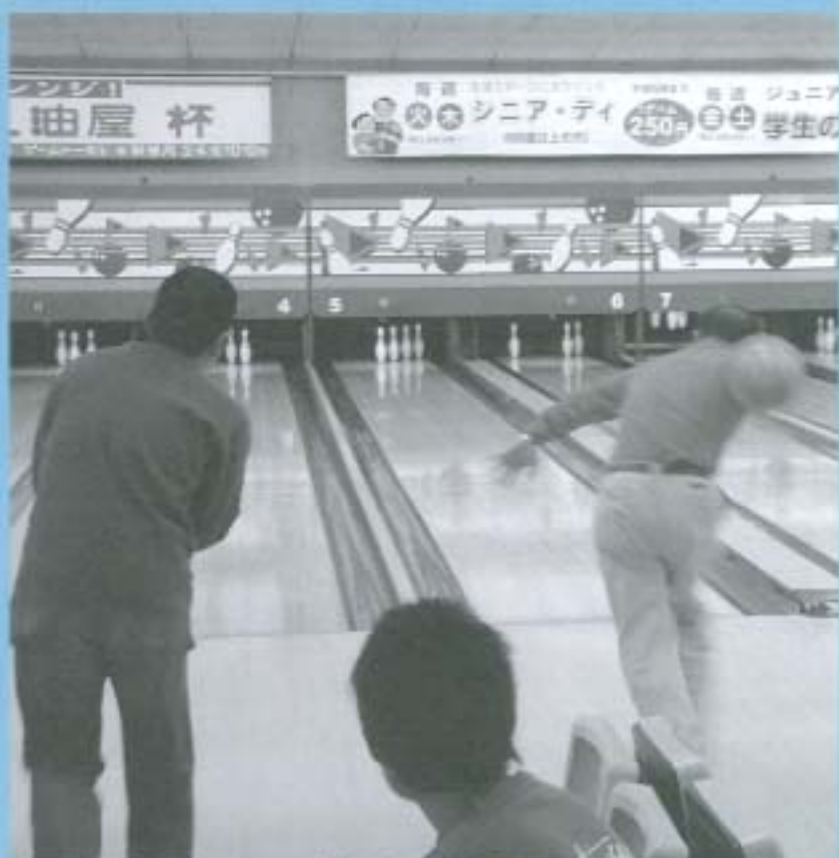
ボーリング大会で