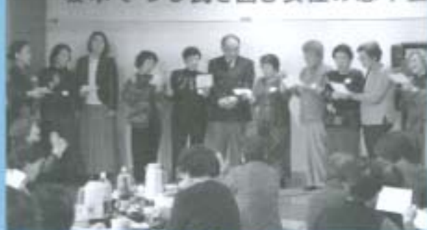
女性の忘年会での一コマ