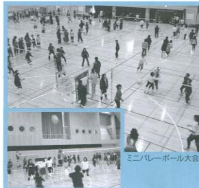
ミニバレーボール大会

いろな問題を時間をかけて話すという訳にはいきません。現在、一番重要な問題をひとつずつ取り上げてしゃべります。そのためには、その問題の発端、過程、今後の進め方を頭の中で整理しておかなくてはなりません。問題の本質を理解して、初めて辻立ちでしゃべれます。逆に言うなら辻立ちを重なることで、問題の本質をあまり出すことが出来ません。辻立ちには自らを鍛える意味も込め今後も続けます。